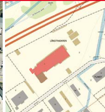
Kartredovisningen har inte rättsverkan, jmfir mot beslut i lantmäterihandlingar.