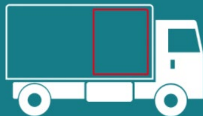
DB SCHENKER part load